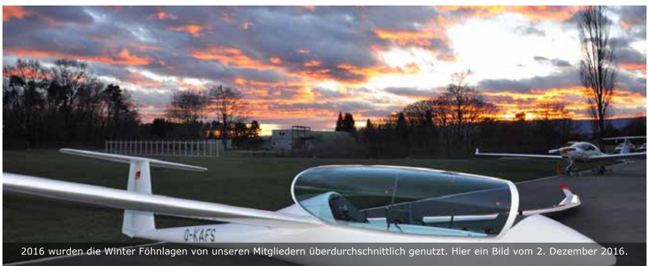
2016 wurden die Winter Föhnlagern von unseren Mitgliedern überdurchschnittlich genutzt. Hier ein Bild vom 2. Dezember 2016.