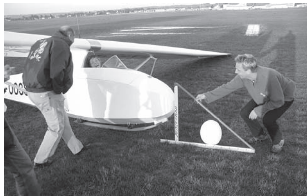
Bild vom Ziellanden 2004