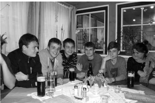
Erfreulich viel Jugend bei der Silver Challenge!

Beide Trainings waren zwar gut besucht jedoch mit wenigen Flugtagen gesegnet.